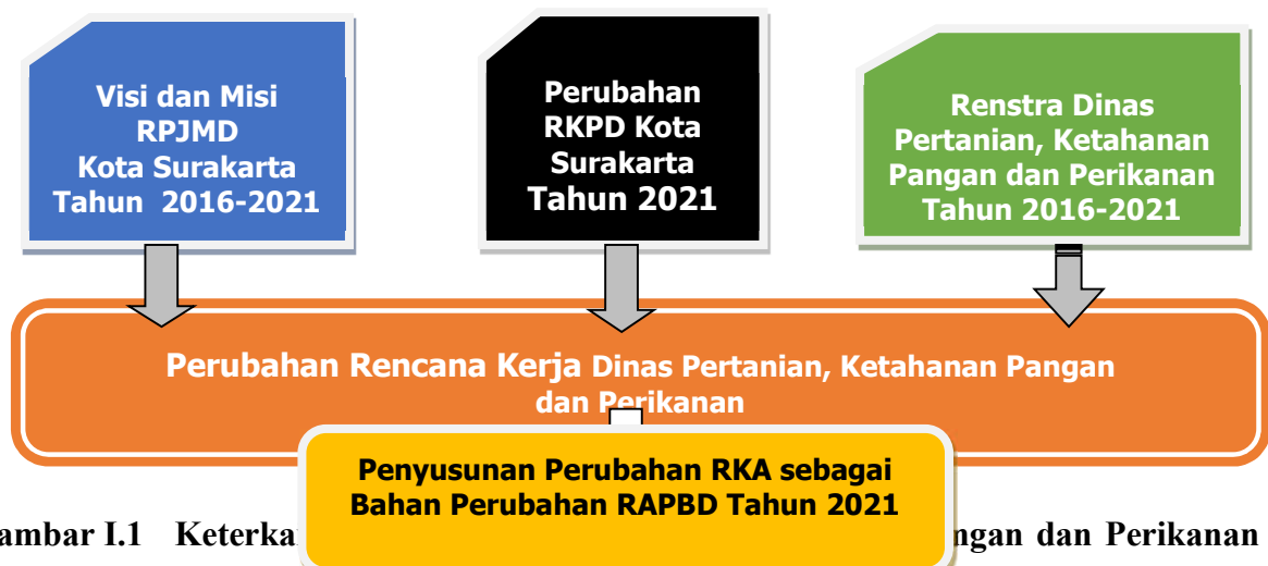
Gambar I.1 Keterkaitan Perubahan Rencana Kerja Dinas Pertanian, Ketahanan Pangan dan Perikanan dengan Dokumen Perencanaan Lainnya

Perubahan Renja Dinas Pertanian, Ketahanan Pangan dan Perikanan akan disinergiskan dengan RKPD Perubahan Kota Surakarta tahun 2021, dengan memperhatikan hasil evaluasi hasil Renja Dinas Pertanian, Ketahanan Pangan dan Perikanan Kota Surakarta sampai dengan triwulan II tahun 2021. Perubahan Renja Dinas Pertanian, Ketahanan Pangan dan Perikanan nantinya akan ditetapkan dengan Peraturan Walikota Surakarta sebagai pedoman dalam menyusun perubahan RKA Dinas Pertanian, Ketahanan Pangan dan Perikanan Tahun Anggaran 2021. Hubungan Perubahan Renja Dinas Pertanian, Ketahanan Pangan dan Perikanan nantinya dengan dokumen lainnya sebagai berikut: